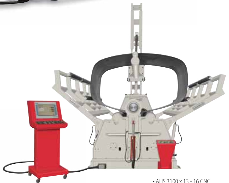
• AHS 3100 x 13 - 16 CNC