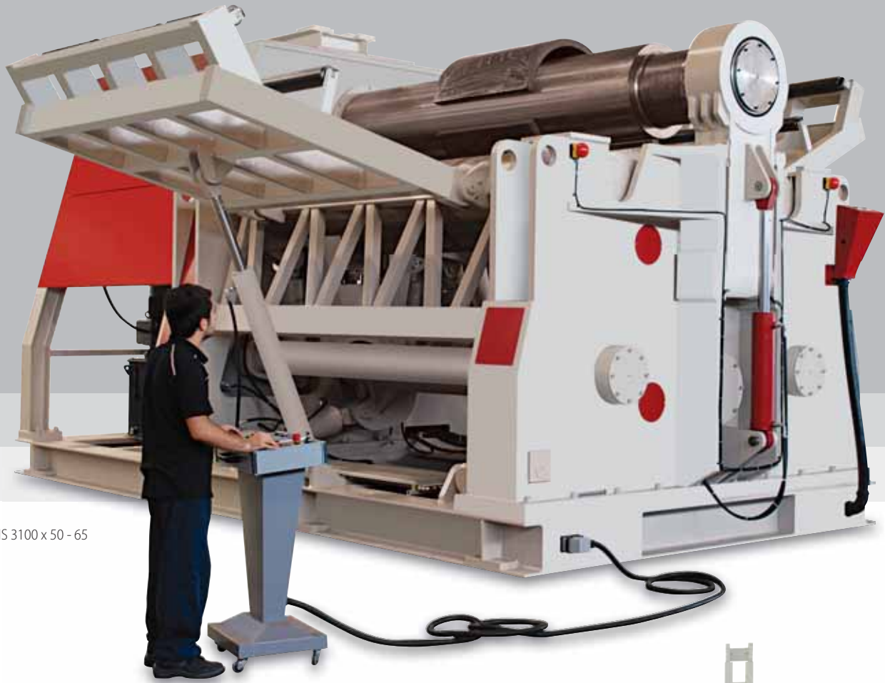
• AHS 3100 x 50 - 65