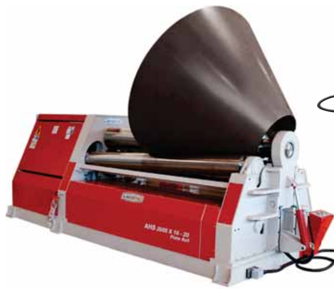
• AHS 2600 x 16 - 20